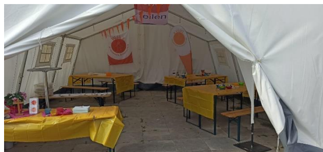
Kirchenzelt vorbereitet für den Bastelvormittag..