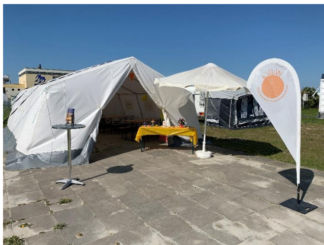
Standort Tossens 2022

Butjadingen ist eine Halbinsel an der Nordseeküste im oldenburgischen Teil des Bistums Münster, eingebettet zwischen Bremerhaven, Wilhelmshaven und Nordsee. Die Halbinsel umfasst die politischen Gemeinden Butjadingen, Nordenham und Stadland. Während fast jedes kleine Dorf eine eigene evangelische Kirche hat, erstreckt sich das Pfarrgebiet der katholischen Pfarrei St. Willehad über die drei politischen Gemeinden. Die Pfarrkirche St. Willehad befindet sich in Nordenham, eine Filialkirche in Burhave. Zur Gemeinde gehört das Selbstversorgerhaus und Pfarrheim „Rat-Schinke-Haus“ in Burhave, sowie das Kommunikationszentrum „OASE“ in Tossens.