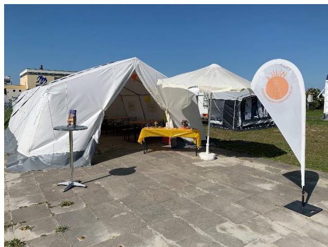
Standort Tossens 2022

Für diese Urlauberkirche suchen wir Familien oder einzelne (junge) Erwachsene, Leiterrunden o. ä., die uns in unserer pastoralen Arbeit unterstützen.