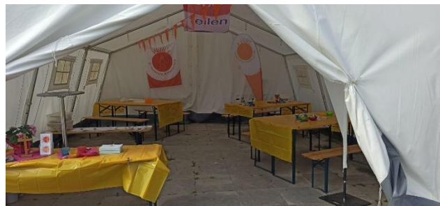
Kirchzelt vorbereitet für den Bastelvormittag..