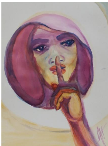
Aquarell: Antonia Neumeier

Text: Irene Keil , Gemeindeferentin im Pfarrverband Nürnberg-Südwest/Stein